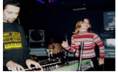
La monja enana