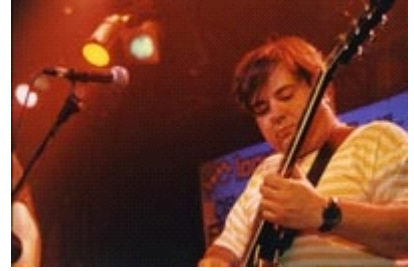
Felipón ex Fresón